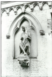
Joueur de harpe