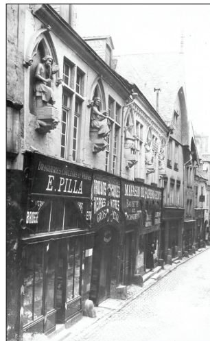
La rue de Tambour et la Maison des Musiciens. (avant 1914).

De nos jours, seules les statues ont pu être sauvées des destructions de la Première Guerre mondiale. Elles sont exposées dans la galerie d'art médiéval du musée Saint-Remi de Reims.