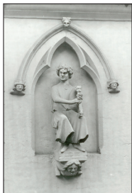
Joueur de chevette (cornemuse)