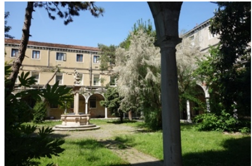
Cloître de l'Ospedale dei Mendicanti

De la charité à l'excellence musicale Les Ospedali (Hospices) de Venise : aux XVII ème et XVIII ème siècles