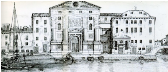
Eglise et Ospedale della Pietà (Tramezzinimag : « La Venise d'avant »)

Rattachés à des paroisses, les Ospedali (hospices), y recueillaient des enfants orphelins ou abandonnés, et offraient aux jeunes filles une formation musicale de très haut niveau, comparable à celui dispensé actuellement dans nos Maîtrises et Conservatoires.