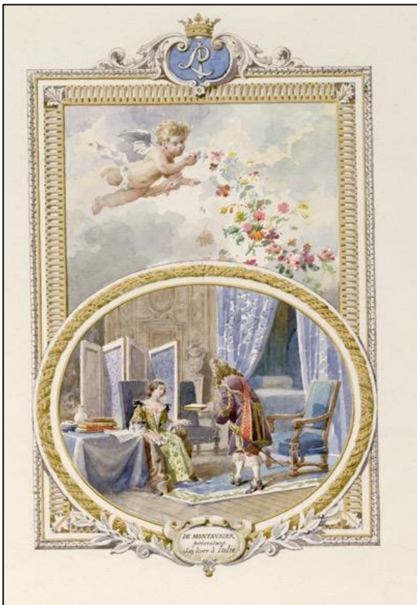
La Guirlande de Julie.

L'industrialisation du livre au long du XIX e siècle incite les bibliophiles à rechercher, dans la production moderne, des exemplaires qui sortent de l'ordinaire, par leurs qualités matérielles et artistiques : tirage limité, qualité de la typographie, du papier, de l'illustration, richesse de la reliure. Ce mouvement conduit certains illustrateurs à proposer des exemplaires enrichis de d'aquarelles originales, et certains collectionneurs à se faire architectes du livre, pour commander des exemplaires uniques. Ce sont les relations qui s'établirent autour du livre entre l'aquarelliste Eugène Auger et Victor Diancourt qu'abordera cette conférence, en s'appuyant sur leur correspondance inédite. Leur collaboration donna naissance à quelques fleurons du livre manuscrit moderne, aujourd'hui conservés à la bibliothèque Carnegie de Reims : La Guirlande de Julie , A Rheims , et Douze poèmes du XIX e siècle .